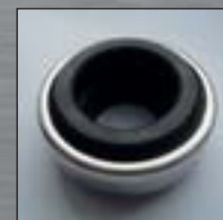
Těsnící segment z karbon-keramiky