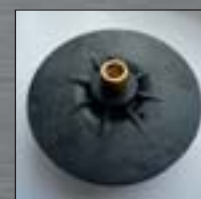
Turbínka s bronzovým zástříkem