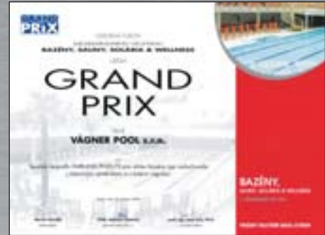
I. místo na veletrhu Bazény, sauny 2009

S HODNOTOU C.O.P. 6 (TZN. AŽ O 20 % VYŠŠÍ ÚČINNOST OPROTÍ BĚŽNĚ PRODÁVANÝM TEPELNÝM ČERPADLŮM)